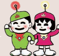
ハニーくん ニハちゃん